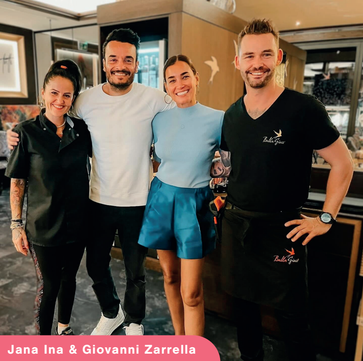
Jana Ina & Giovanni Zarrella